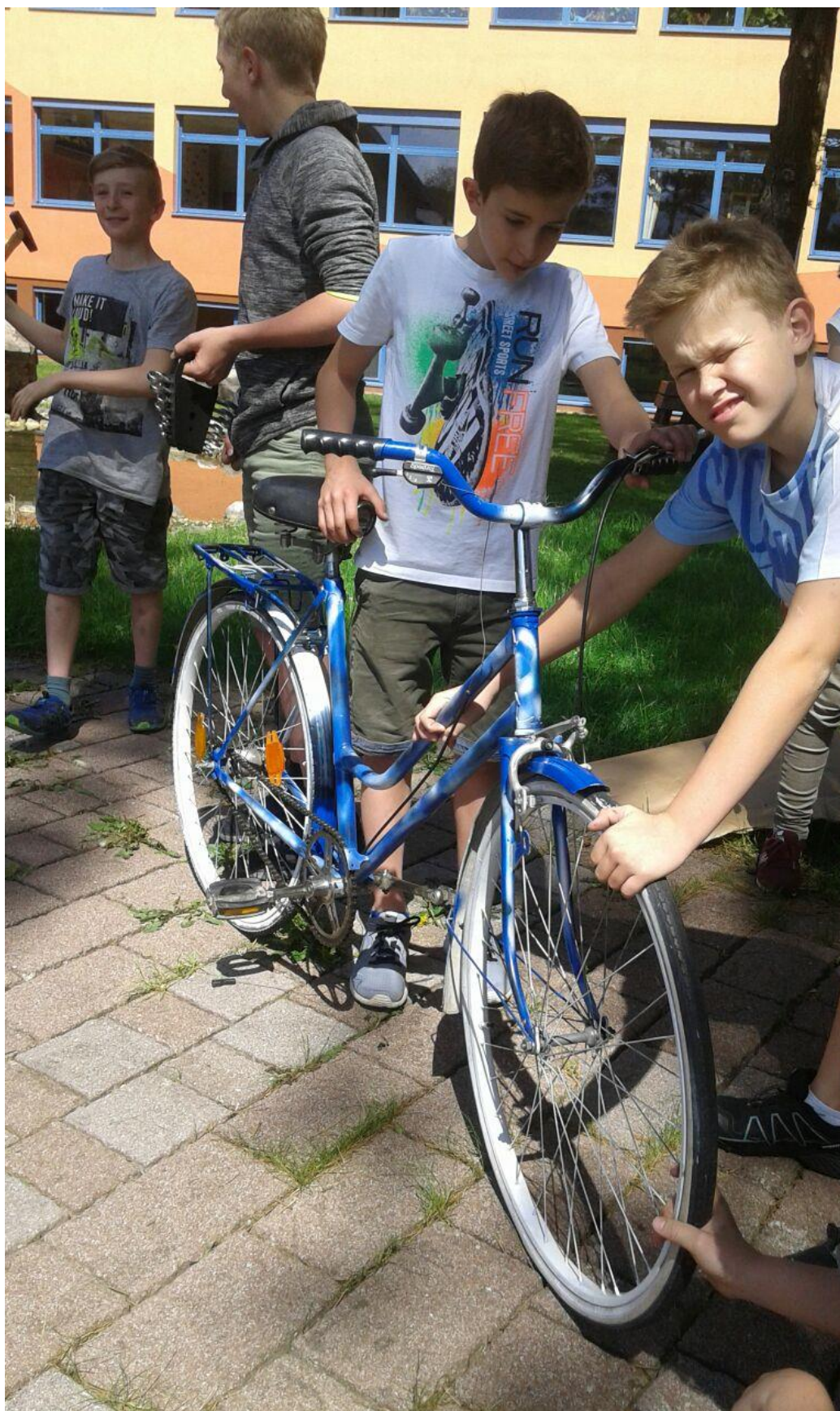
Das Werk ist vollbracht – fast wie neu!!!!